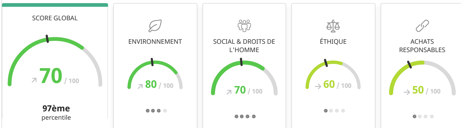
Répartition des scores globaux